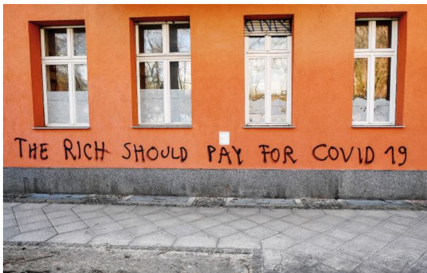
Grafit v Berlinu

Sedanji položaj ni tako nevaren zgolj zaradi mrtvih, ki jih je z vsakim dnevom več, temveč zaradi splošne ustavitve gospodarske ureditve, saj ta tistim, ki želijo pri begu s sveta iti še veliko dlje, ponuja fantastično priložnost, da »podvomijo o vsem«. Ne smemo pozabiti, da globalizatorje dela tako nevarne prav njihova zavest, da so poraženi, da zanikanje podnebnih sprememb ne more trajati v nedogled in torej ni več možnosti, da bi njihov »razvoj« spravili z različnimi območji planeta, na katera bo treba nehati gospodarsko posegati. Da bi še zadnjič vzpostavili razmere, ki bi jim omogočile še nekoliko dlje obstati ter zavarovati sebe in svoje otroke, so pripravljene poskusiti karkoli. »Zamrznitev sveta«, ta ustavitev, ta nepredvideni premor jim ponuja priložnost pobegniti še hitreje in še dlje, kot so si sploh lahko zamišljali. 3 V tem hipu so prav oni revolucionarji.